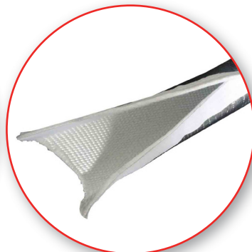
Abierto (cierre velcro)